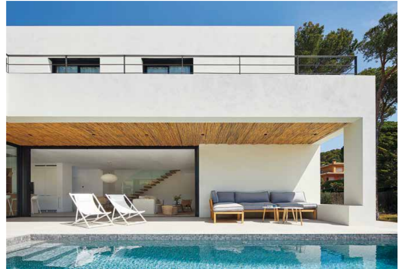
TEXTOS: PABLO ESTELA.